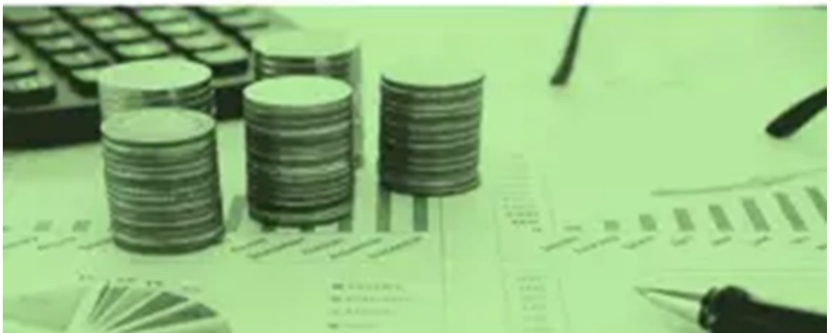
Servicio de Gestión Económico-financiera