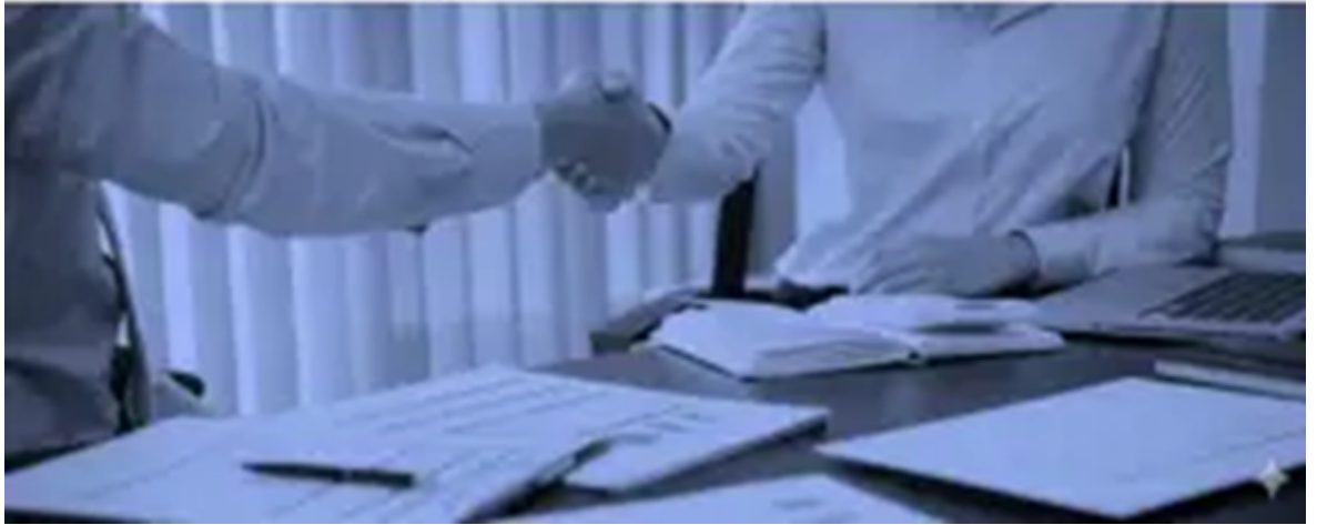
Servicio de Contratación y Gestión Patrimonial