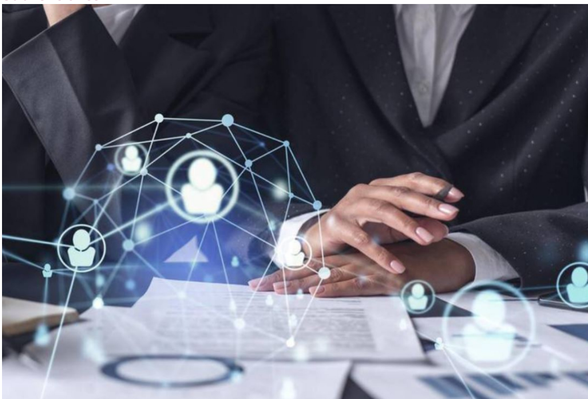
Convenios de ámbito económico