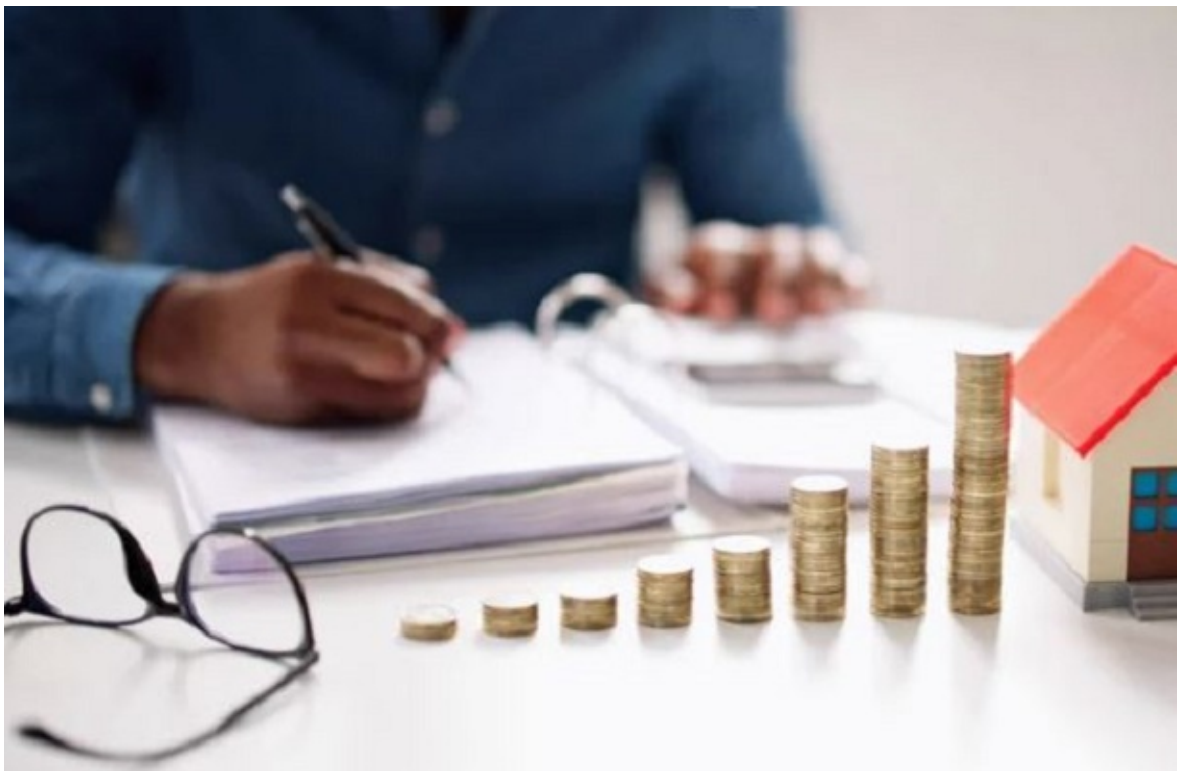
Catálogos de Precios Públicos