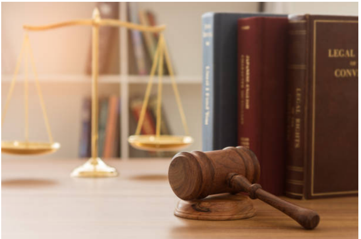
Normativa sobre subvenciones