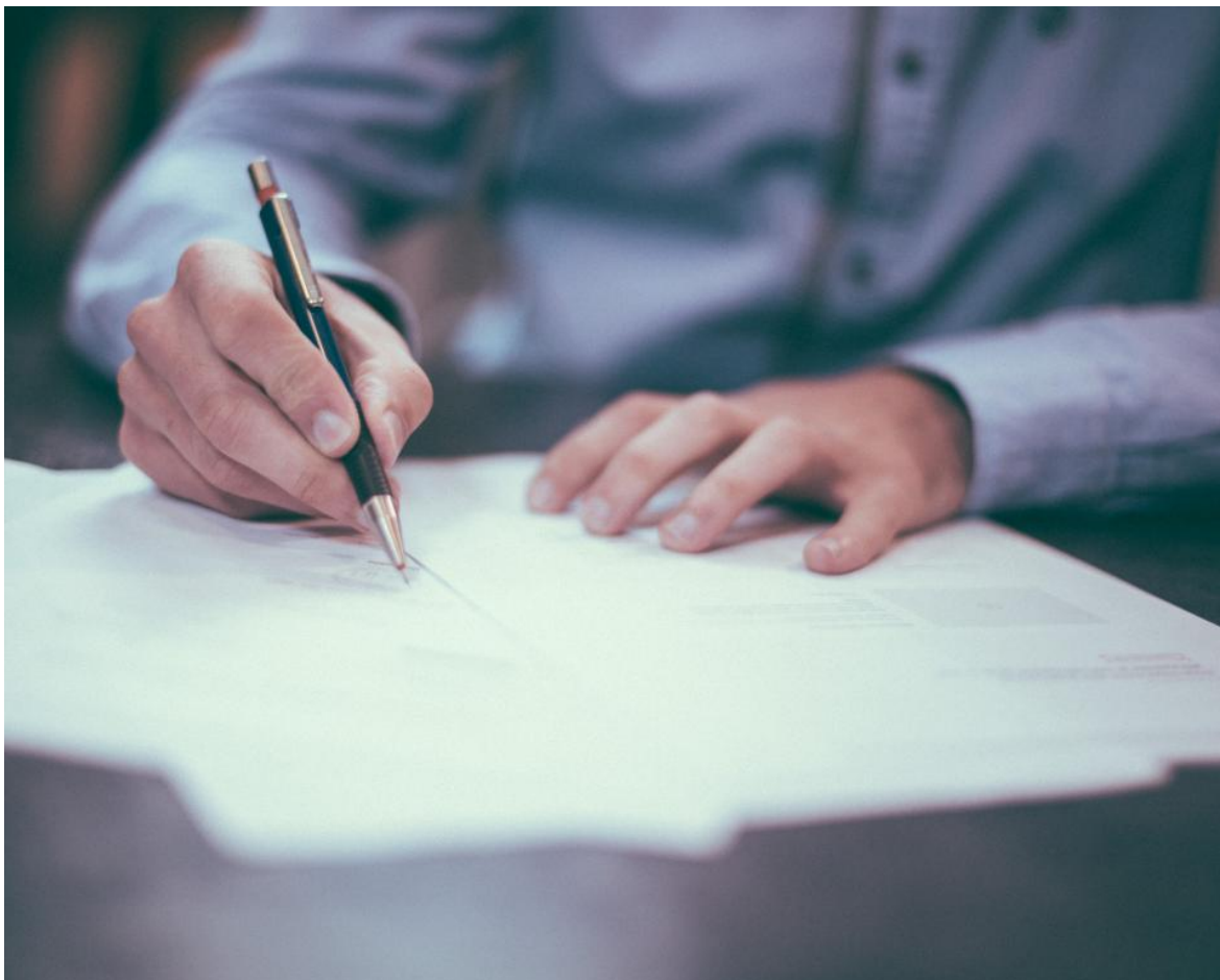
Convenios de ámbito económico